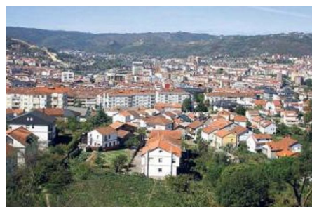
Vista de la ciudad de Ourense, desde Montealegre.