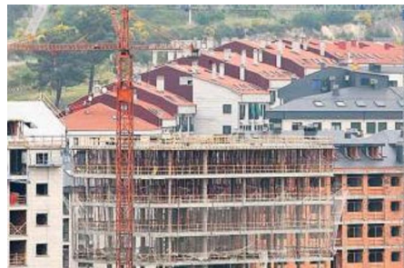
Viviendas en construcción en Ourense. Jesús Regal

Por lo que respecta al precio de la vivienda de alquiler oscila entre los 300 y los 500 euros, "pero está aumentando mucho la morosidad en el pago, lo que obliga al propietario a exigir muchos avales previos al inquilino", advierte Benito Iglesias.