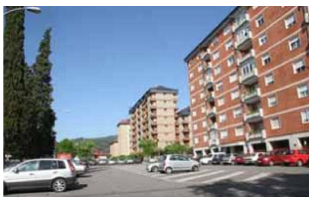
Vista parcial de As Lagoas, la zona hacia donde más se ha orientado la búsqueda de pisos. Iñaki Osorio

La acumulación de grandes bolsas de viviendas vacías, debido a la especulación urbanística de los últimos