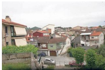
Vista de una zona del rural del municipio.

No hay como un mes en números rojos para volver a casa de mamá y traerse la mejor cocina cazada en un "tuper". De igual modo y a causa de la crisis se está produciendo un despegue de las viviendas para rehabilitar o ya rehabilitadas en concellos del rural próximos a la ciudad, mercado cuyas ventas se han disparado un 118% en los últimos meses, según la Asociación de Empresarios Inmobiliarios de Ourense. Mientras, y a la espera de una mejora de las coordenadas económicas, el precio de la vivienda nueva bajó un 8% y un 19% el de la usada.