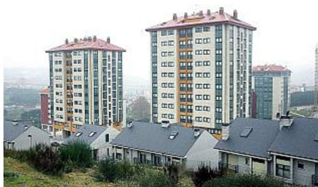
nueva urbanización en la ciudad